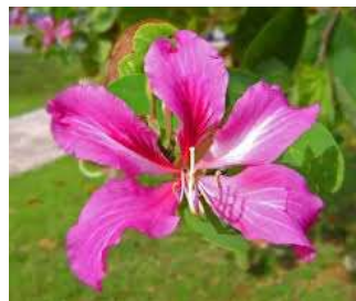
ดอกชงโค สีชมพู